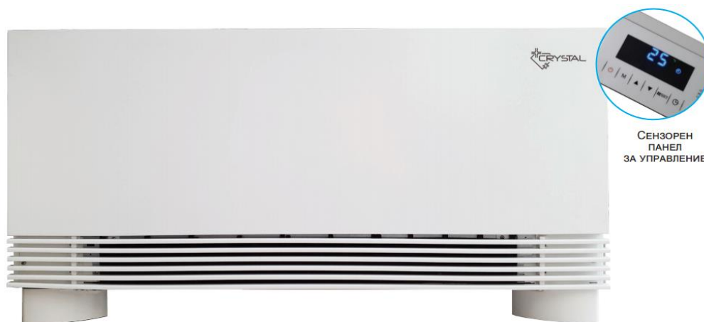
СЕНЗОРЕН ПАНЕЛ ЗА УПРАВЛЕНИЕ

(3) Охладителна мощност при температура вода 7°C/12°C и стайна температура (DB/WB) 27°C/19°C.